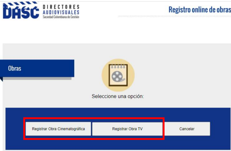
Imagen 3. Selección “Registrar Obra Cinematográfica” o “Registrar Obra TV”

Una vez se selecciona la opción, “Registrar Obra” se habilitan las posibilidades para Registrar Obra Cinematográfica o Registrar Obra TV. La selección del formato dependerá de dónde fue o será emitida comercialmente la obra con el fin de reclamar los porcentajes sobre ésta. Dirigirse al apartado Terminología en caso de verificación.