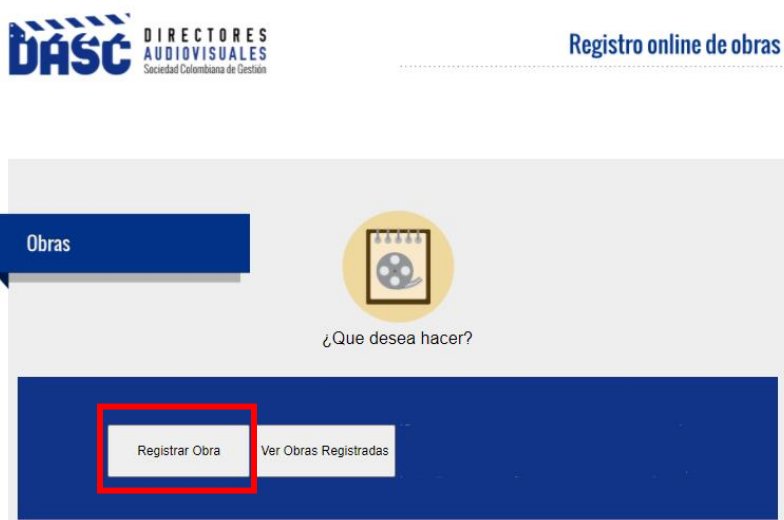
Imagen 2. Selección “Registrar Obra”