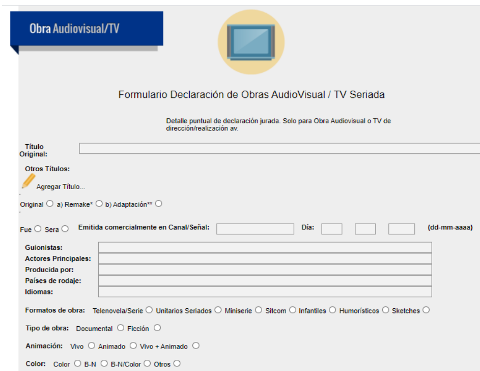
Imagen 7. Formato de solicitud derechos de dirección sobre Obra TV Seriado