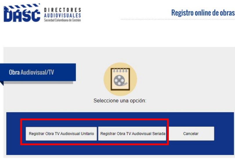
Imagen 5. Selección “Registrar Obra TV Audiovisual Unitario” o “Registrar Obra TV Audiovisual Seriado”

En este apartado se encuentran las opciones, “Obra TV Audiovisual Unitario” y “Obra TV Audiovisual Seriado”. Se selecciona “TV Audiovisual Unitario” para obras Telefilm, videoclips musicales o Unitario, y “TV Audiovisual Seriado” para obras en las que se dirijan varios capítulos del ciclo como los son Telenovela, Serie, Miniserie, Sitcom, Infantiles, Sketches y Humorísticos.